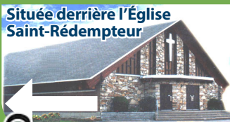
Située derrière l'Église Saint-Rédempteur

ASSOCIATION DES PERSONNES AVEC PROBLÈMES AUDITIFS DES LAURENTIDES